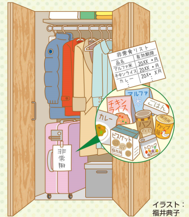
イラスト: 福井典子

自宅に備えておきたい非常食。3日~1週間分は備蓄したほうが良い でしょう。収納場所に困りますが、意外にお勧めなのが旅行用の スーツケースの中。頑丈でキャスター付きなので出し入れがしやすい というメリットがあります。食料の内容と数、賞味期限をメモして目につく ところに貼っておけば、期限切れの心配もありません。日常的に ストックしている賞味期限の長い食品を非常食の一部と考えるのもお 勧め。ポリ袋に入れて湯せんすれば、米を炊いたり、パスタを茹でるこ も可能。カセットコンロがあれば停電時に温かい食事が食べられ ると、さまざまなレシピが考案されています。一度試して調理法をマ スターしましょう。